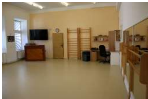
Nová krytina tanečního sálu